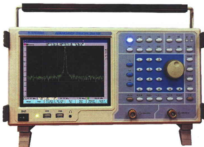
Рисунок 1 - Общий вид анализатора спектра СК4-105

Место пломбировки с нанесением знака поверки